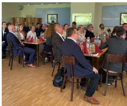
Volles Haus im Robben Café