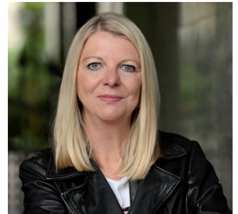
Andrea Weiss

Der Impulsvortrag war gespickt mit vielen Praxisbeispielen sowie konkreten Tipps und Ideen. Angeregt von den Möglichkeiten wurde das Forum beim anschließenden Netzwerken für einen inspirierenden Austausch genutzt.